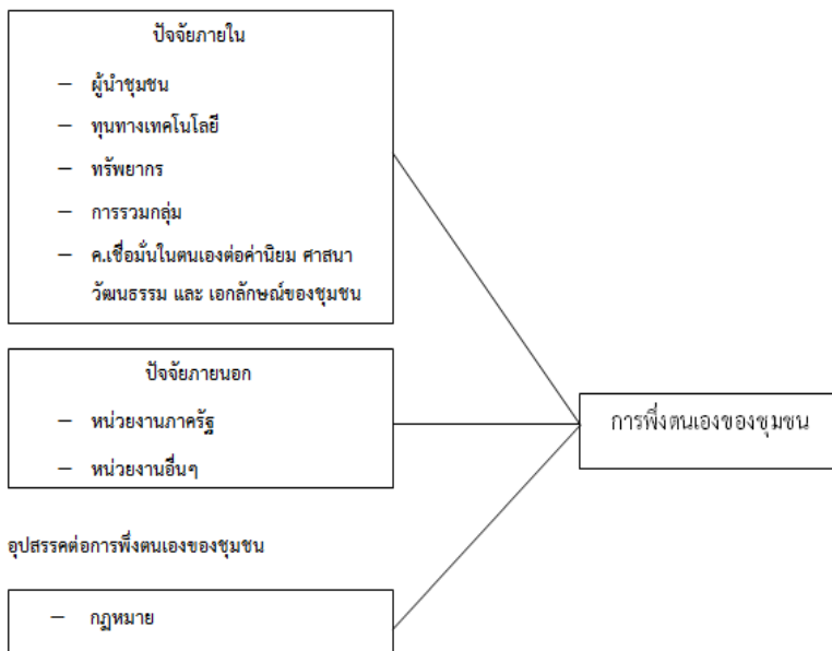
ภาพที่ 1: กรอบแนวคิดในการวิจัย